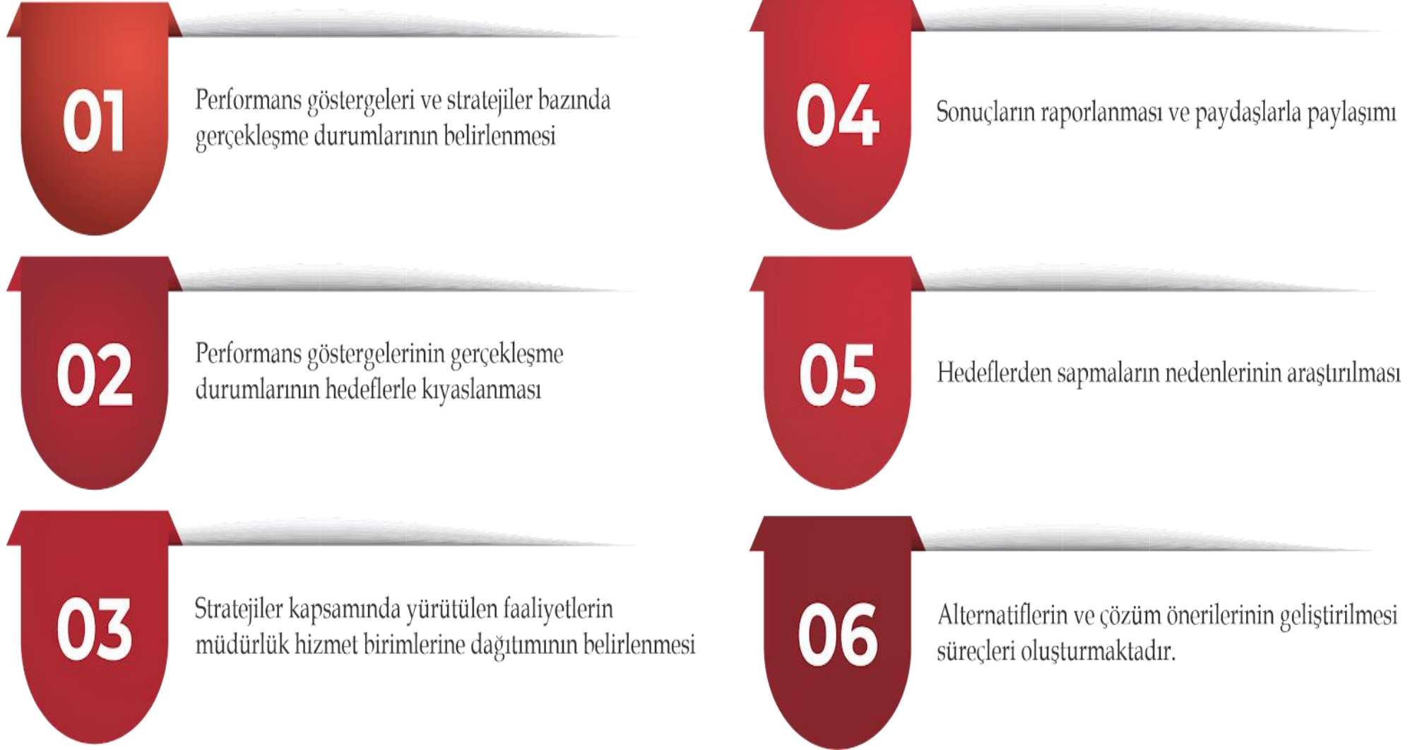
Şekil 5. Stratejik Plan İzleme ve Değerlendirme Çerçevesi