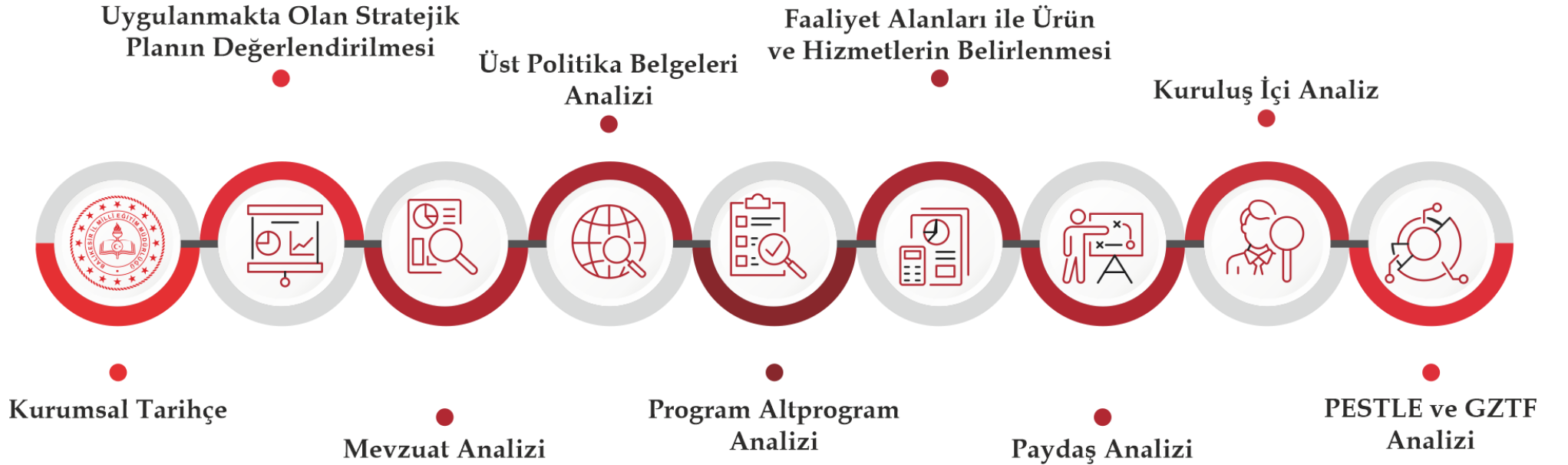
Şekil 3. Durum Analizi

Durum analizi: kurumsal tarihçe, uygulanmakta olan stratejik planın değerlendirilmesi, mevzuat analizi, üst politika belgeleri analizi, faaliyet alanları ile ürün ve hizmetlerin belirlenmesi, kurum içi analiz, PESTLE analizi ve GZFT analizlerinden oluşmaktadır.