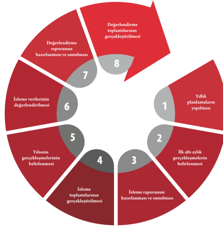
Şekil 6. İzleme Değerlendirme Süreci

Şehit Kadir Altınöz İlkokulu 2024-2028 Stratejik Plan'ının izleme ve değerlendirme süreci ve takvimi Şekil 6 'da ifade edilmiştir.